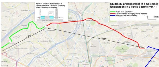
Analyse von Betriebslösungen