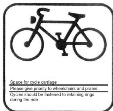
Piktogramme für Rollstuhl und Fahrradbereiche (Diskussionsgrundlage)