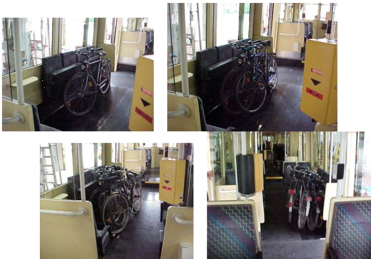
Fahrzeugmitnahme in Karlsruher Stadtbahnfahrzeugen