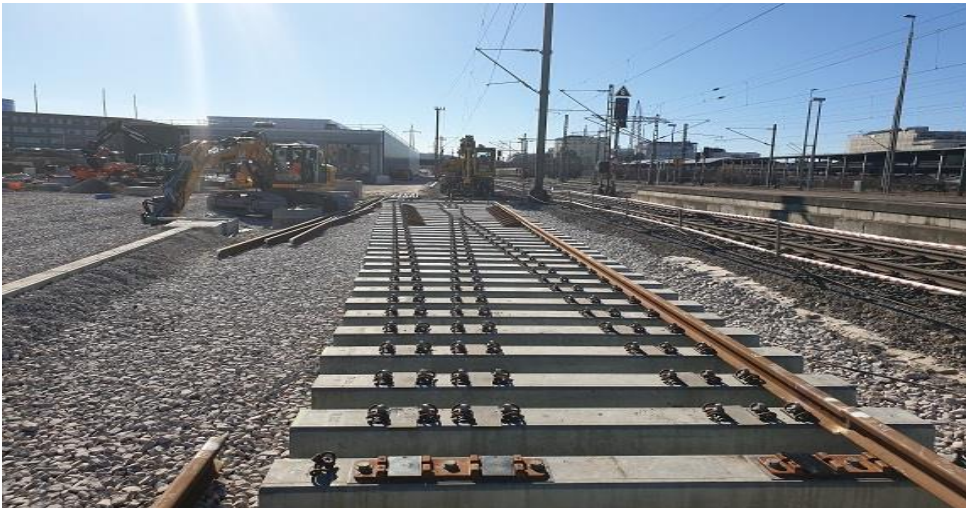
Anschlussweiche im Betriebshof Böblingen

Vor dem Hintergrund steigender Fahrgastzahlen und dem in den neunziger Jahren zu gering prognostizierten Ausgangsniveau an Fahrgästen sind die Bahnanlagen der Schönbuchbahn für den heutigen und insbesondere zukünftig zu erwartenden Bedarf nicht ausreichend dimensioniert.