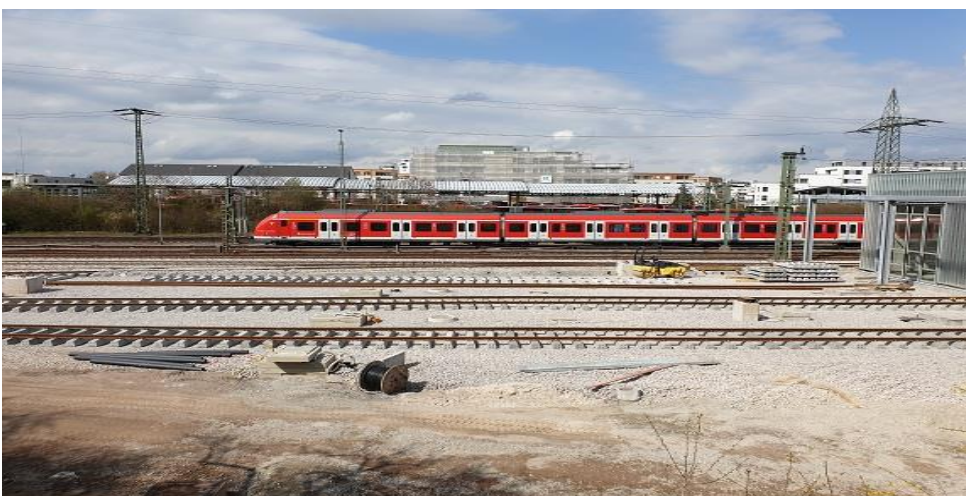
Gleisvorfelder Betriebshof Böblingen