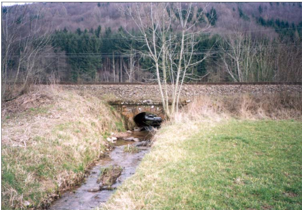
Siphon à renouveler, au pk 23,250