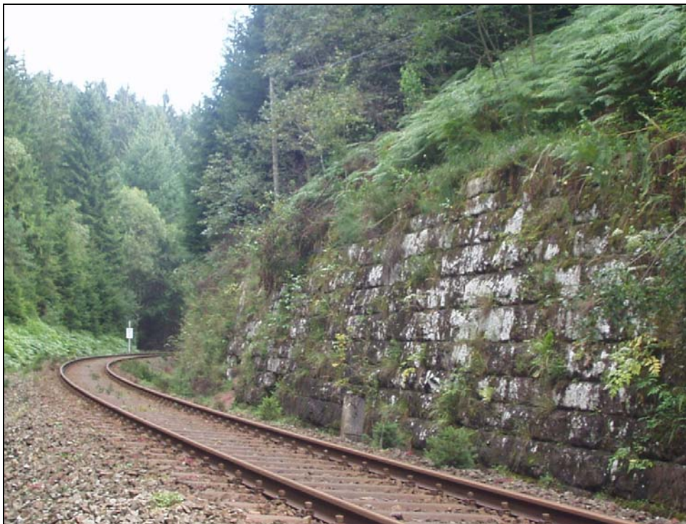
Mur de soutènement à renouveler sur la ligne Schiltach-Eutingen