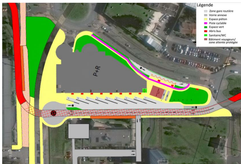
Maximalausstattung der Parzelle des Standorts Arts et Métiers

Die Stadt Bordeaux steuern jeden Tag zahlreiche Busse der Fernbusanbieter Flixbus und Bla-BlaBus an. Derzeit werden sie auf dem Descas-Gelände entlang des Quai de Paludate empfangen. Das Gelände soll kurzfristig geräumt werden, um Platz für ein Immobilienprojekt zu schaffen.