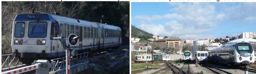
Le matériel roulant en service

Expertise infrastructure : points visités et analyse des coûts comparés avec des lignes autrichiennes