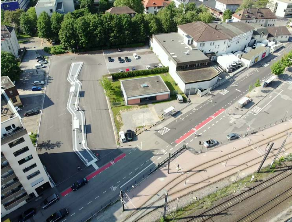
Abbildung 1: linke Bildseite ZOB nach Fertigstellung, linke Seite der Bahnhofstraße 3 neue Bushaltestellen