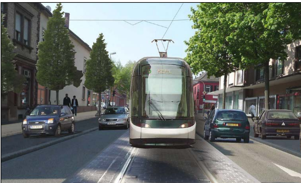
Großherzog-Friedrich-Straße 2010 (oben) und Fotomontage mit eingleisiger Tramstrecke