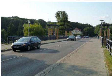
Nedlitzer Nordbrücke im Querschnitt ohne und mit Straßenbahnschienen