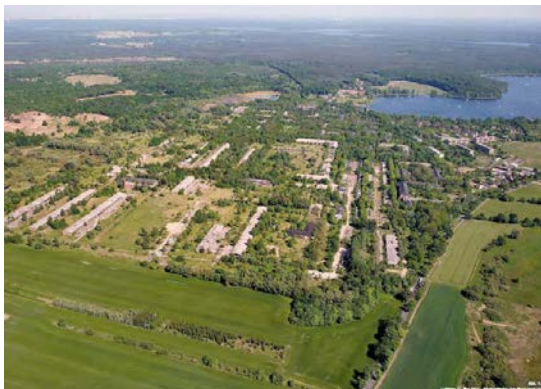
Entwicklungsbereich Krampnitz

TTK war im Projekt als Partner der PTV für die Infrastrukturplanung und die Kostenschätzung verantwortlich.