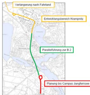
Übersicht über den Trassenverlauf