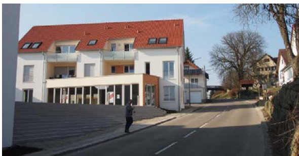
Gaisbach Mitte mit neuer Bebauung und ehemaliger B 19