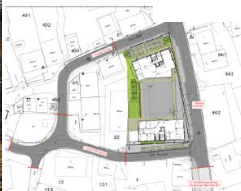
Planungen für den Bereich Ortsmitte