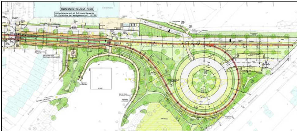
Tracé en plan : Terminus avec voie de garage et boucle de retournement avec parking intégré

Planification du tracé d'une nouvelle ligne de tramway de 3 km avec 6 stations incluant le réaménagement des voies