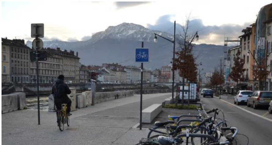
Ortsbegehung: Integration der Elemente «Nutzerattraktivität» in die GIS-Datenbank

Darüber hinaus wird die TTK den technischen Dienst bei der Umsetzung unterstützen