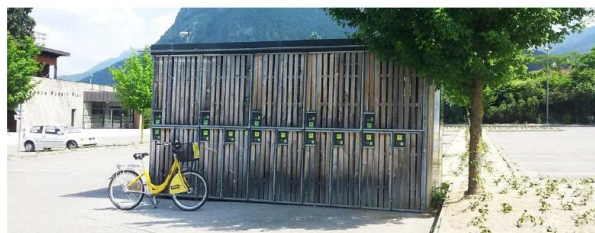
Figure 1 : Exemples d'aménagements et dispositifs mis en place pour favoriser la pratique du vélo